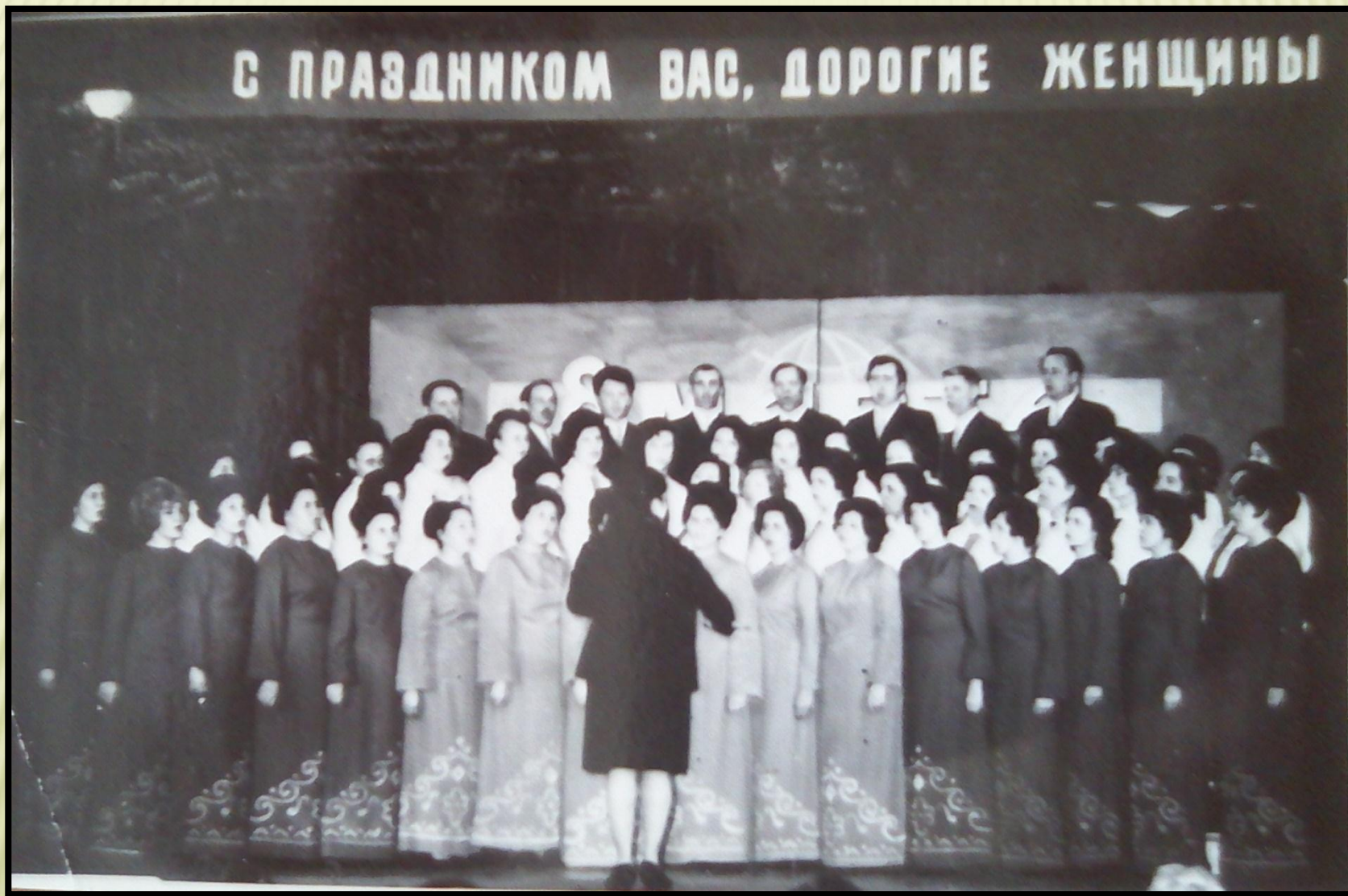
Хор учителей школы № 1.

Уже через год его приглашают в школу № 1.