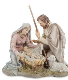
Б) Рождество Христово